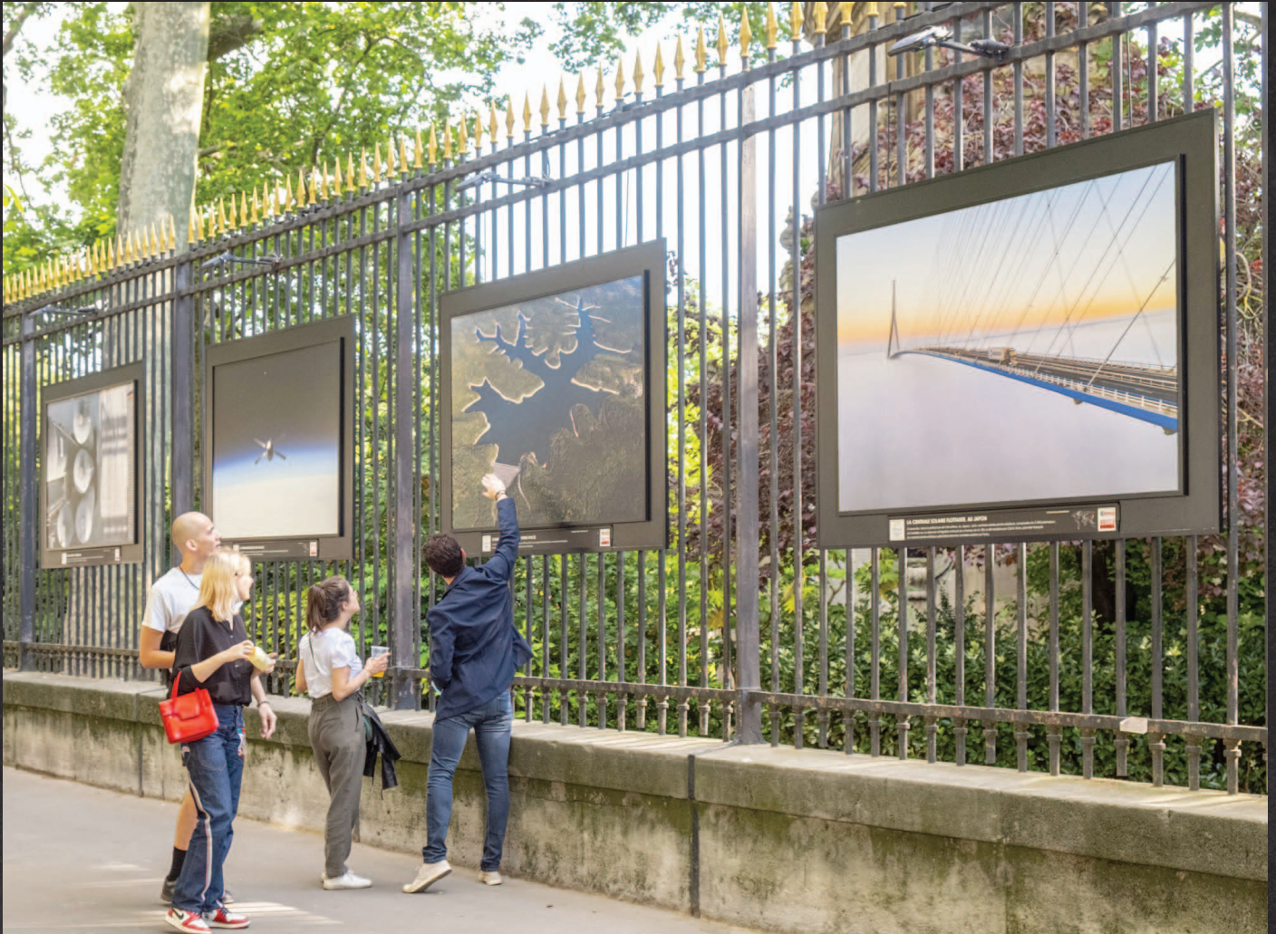
Paris, Palais du Sénat, grilles du jardin du Luxembourg, mars-juillet 2020